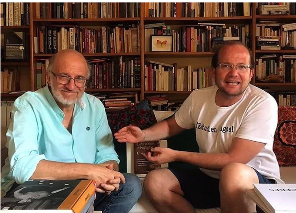
Daniel Samper Pizano y Daniel Samper Ospina